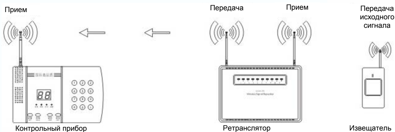
Диаграмма работы ретранслятора

Ретранслятор может использоваться как отдельный контрольный прибор.